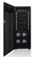
Haut niveau d'intégration : quatre commutateurs intégrés