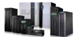
Delta offre une gamme complète de solutions UPS de 600 VA à 4 000 kVA pour satisfaire vos besoins en sécurité de puissance.